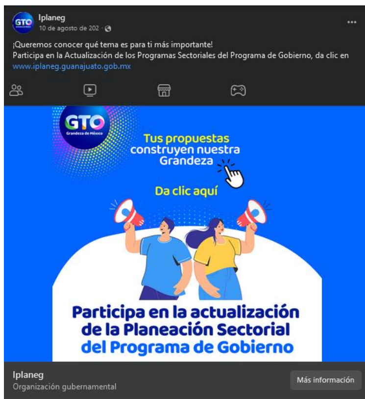
Consulta social en Facebook.

Definida la plataforma de consulta, se invitó a representantes de los Consejos Sectoriales, Cámaras Empresariales, Asociaciones Civiles, Universidades, Observatorios Ciudadanos, Colegios de Profesionistas, Organismos de Planeación Municipal y público en general, recibiendo un total de 2,202 participaciones. Los resultados estuvieron disponibles en las redes sociales del Iplaneg https://www.facebook.com/iplaneg , y https://twitter.com/iplaneg