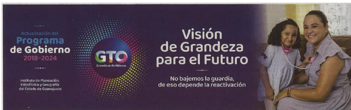
Ejemplo de publicación en "Reporte Índigo".

Para la actualización del Programa de Gobierno 2018-2024, y para dar cumplimiento al artículo 44 de la Ley de Planeación, se notificó a la ciudadanía del inicio del proceso a través de la publicación del proceso de consulta a través de los diarios de mayor circulación en el estado.