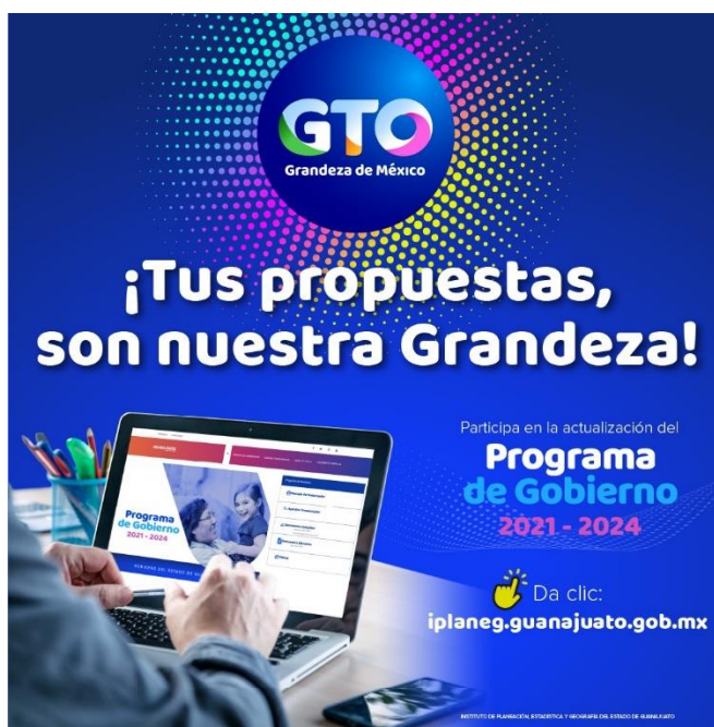
Banner de invitación a responder la consulta social en línea.

https://participa2040.guanajuato.gob.mx/ .