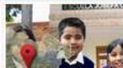
Inventario Escolar y Educativo