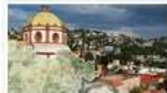
Mapa Turístico del Edo de Gto.