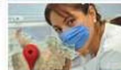
Instituciones de Salud en Gto.