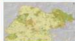
Mapa Base del Edo Gto