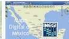
Mapa Digital de México