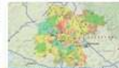
Invirtiendo en Guanajuato

Además de otros SIG que ofrecen información temática construida con propósitos específicos, como es el caso de los programas sociales de la Sedesol, como pueden ser el de Transporte del Estado, predios Conafor, Turismo y Educación entre otros.