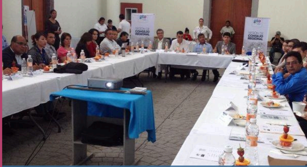
● 1a Sesión Ordinaria 2014 Consejo Regional IV Sur.