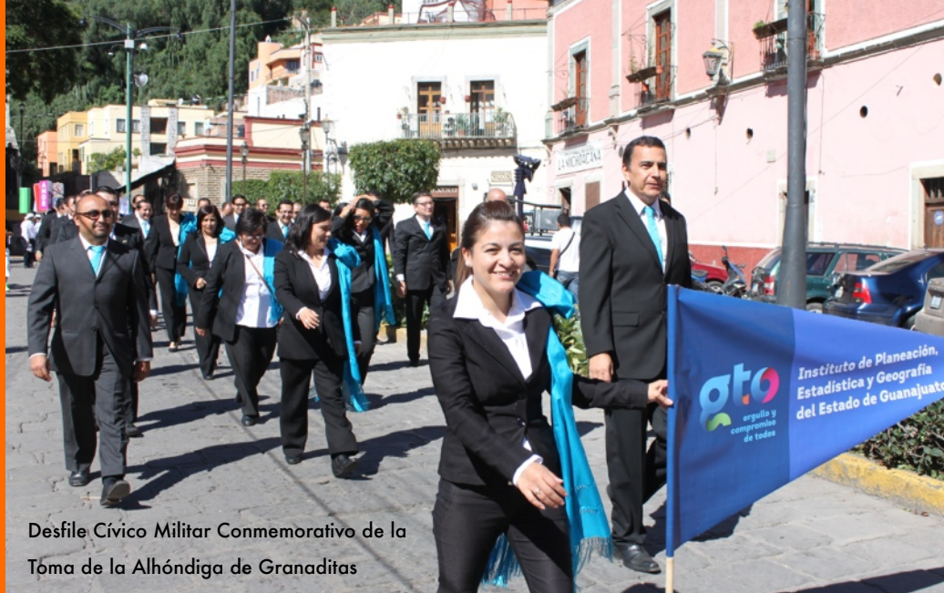
Desfile Cívico Militar Conmemorativo de la Toma de la Alhóndiga de Granaditas