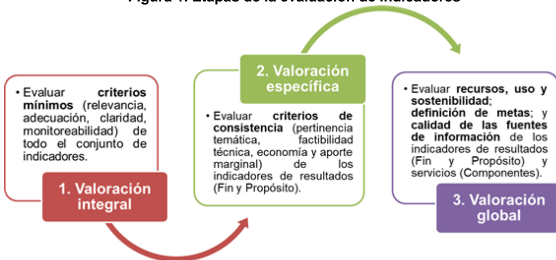
Figura 1. Etapas de la evaluación de indicadores

Para llevar a cabo la evaluación de indicadores, se contempla un esquema de tres etapas, mismas que implican un proceso gradual e incorporan criterios de valoración particulares . Las etapas que integran la evaluación deberán aplicarse de forma consecutiva, esto es, no podrán omitirse etapas como parte del proceso de evaluación.