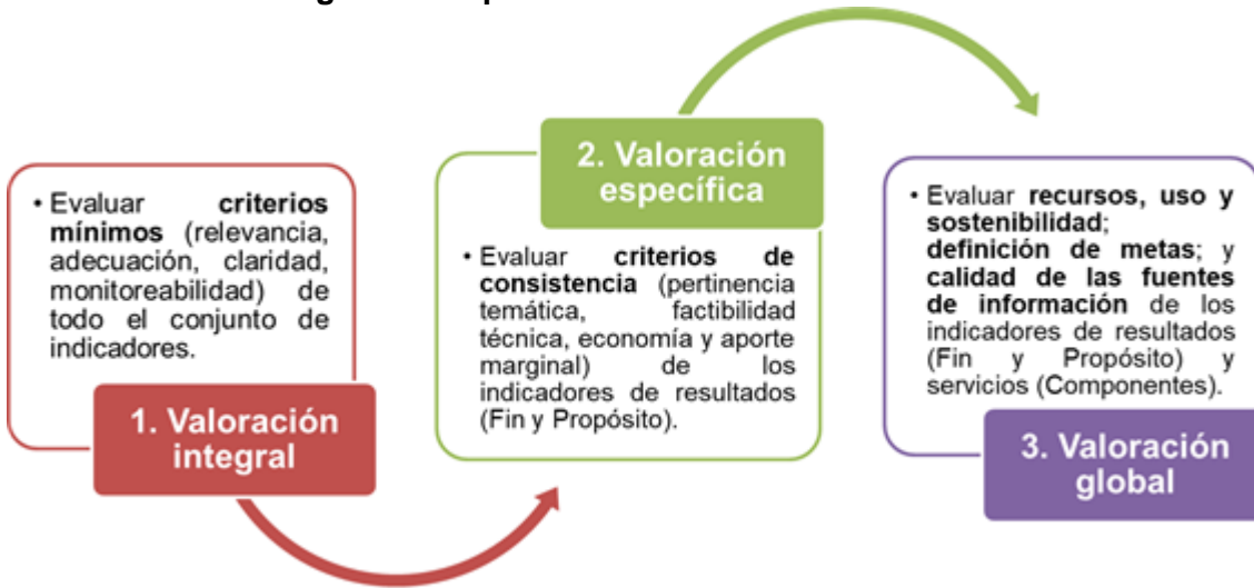
Figura 1. Etapas de la evaluación de indicadores

Para llevar a cabo la evaluación de indicadores, se contempla un esquema de tres etapas, mismas que implican un proceso gradual e incorporan criterios de valoración particulares . Las etapas que integran la evaluación deberán aplicarse de forma consecutiva, esto es, no podrán omitirse etapas como parte del proceso de evaluación.