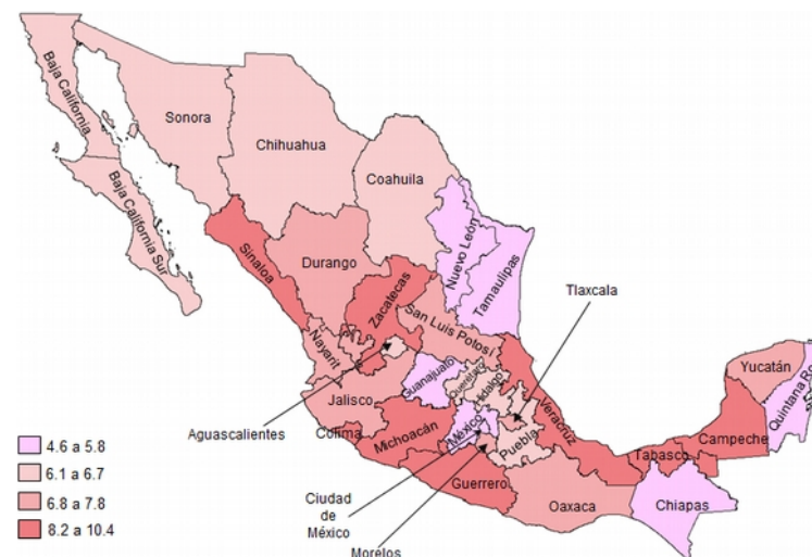
Mapa 1. Prevalencia de discapacidad en personas de 5 años o más por entidad federativa. 2018.