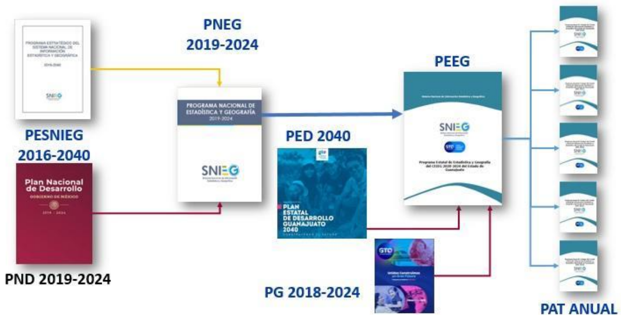
Alineación Programa Estatal de Estadística y Geografía (PEEG)

Con el fin de evidenciar la congruencia de los objetivos y proyectos de este Programa Estatal de Estadística y Geografía con los objetivos estratégicos del Plan Estatal de Desarrollo 2040, y con los objetivos del Programa Nacional de Estadística y geografía 2019-2024 a continuación se presenta la alineación del PEEG con los instrumentos nacional y estatal mencionados, permitiendo con ello disponer de elementos para un adecuado seguimiento de las aportaciones tanto, hacia la formulación de políticas públicas estatales, como de la entidad a los programas del Sistema.