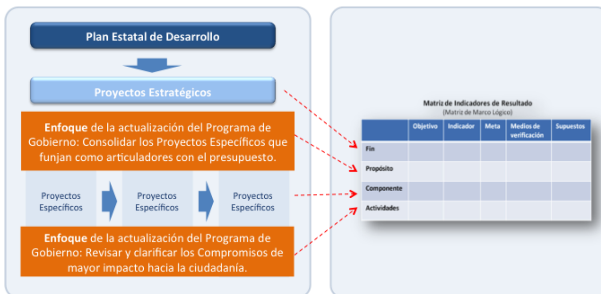
Figura 2. Enfoque de la actualización del Programa de Gobierno

Es importante señalar que uno de los cambios más significativos en esta actualización del Programa de Gobierno, es la vinculación de los elementos de gestión del Programa, los compromisos de Gobierno y los proyectos específicos, con la gestión por resultados. En este sentido, se buscó una relación más directa entre lo contenido en este instrumento de planeación, y lo que se establezca en los programas presupuestarios del 2016 en adelante.