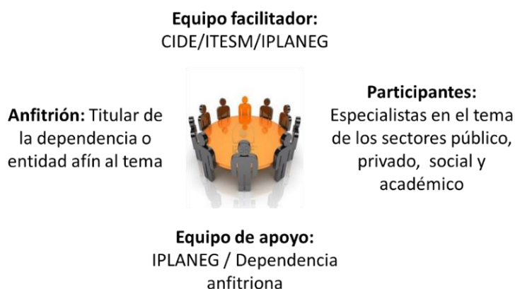
Conformación genérica de las mesas de análisis estratégico

Las mesas de análisis fueron presididas por el Titular de la dependencia o entidad afín al tema y en ellas participan representantes de los sectores público, privado, social y académico en calidad de expertos en el tema en cuestión. En el caso de la mesa de ENVEJECIMIENTO y ADULTOS MAYORES , fue presidida por el Titular del Sistema Estatal para el Desarrollo Integral de la Familia y la facilitación de la metodología estuvo a cargo del personal del Instituto de Planeación, Estadística y Geografía del Estado de Guanajuato, Iplaneg.