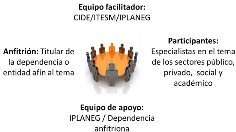
Conformación genérica de las mesas de análisis estratégico