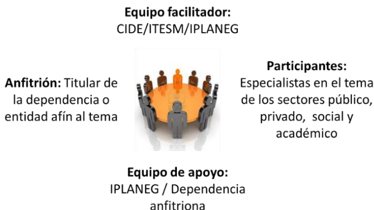
Conformación genérica de las mesas de análisis estratégico

Las mesas de análisis fueron presididas por el Titular de la dependencia o entidad afín al tema y en ellas participan representantes de los sectores público, privado, social y académico en calidad de expertos en el tema en cuestión. En el caso de la mesa de MIGRACIÓN la mesa fue presidida por la Titular del Instituto Estatal de Atención al Migrante Guanajuatense y sus Familias y la facilitación de la metodología estuvo a cargo del personal del Instituto de Planeación, Estadística y Geografía del Estado de Guanajuato, IPLANEG.