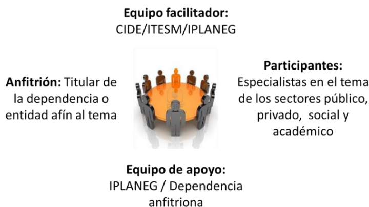
Conformación genérica de las mesas de análisis estratégico

Las mesas de análisis fueron presididas por el Titular de la dependencia o entidad afín al tema y en ellas participan representantes de los sectores público, privado, social y académico en calidad de expertos en el tema en cuestión. En el caso de la mesa de NIÑAS, NIÑOS Y ADOLESCENTES , fue presidida por la Secretaria Ejecutiva del Sistema Estatal de Protección de Niñas, Niños y Adolescentes y la facilitación de la metodología estuvo a cargo del personal del Instituto de Planeación, Estadística y Geografía del Estado de Guanajuato, Iplaneg.