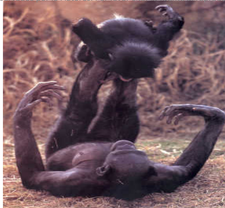
BONOBO: The Forgotten Ape F.B.M. de Waal & Fran Lanting (Photographer) Paperback: 234 pages U California Press: 1997 List price: $27.50 ISBN 0-520216512

© Derechos Reservados por lo Autores. Por favor citar la fuente al reproducir el material.